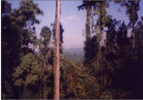
doc. FWI Simpul Sulawesi