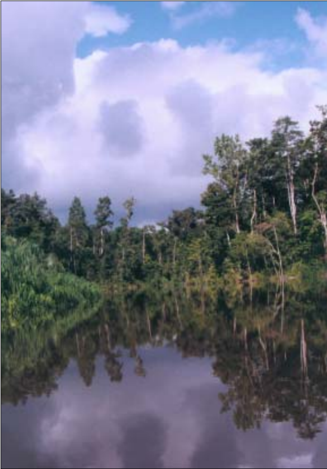
doc. FWI Simpul Papua

kelompok-kelompok masyarakat sipil berada di garis depan untuk menekan keterbukaan informasi resmi dan mempublikasikan hasilnya. Dengan terbukanya informasi ini, sejauh mana sumber-sumber daya alam Indonesia – terutama hutan – telah disalahgunakan dan diboroskan kemudian menjadi jelas. Sekarang kisah ini akan mulai diceritakan.